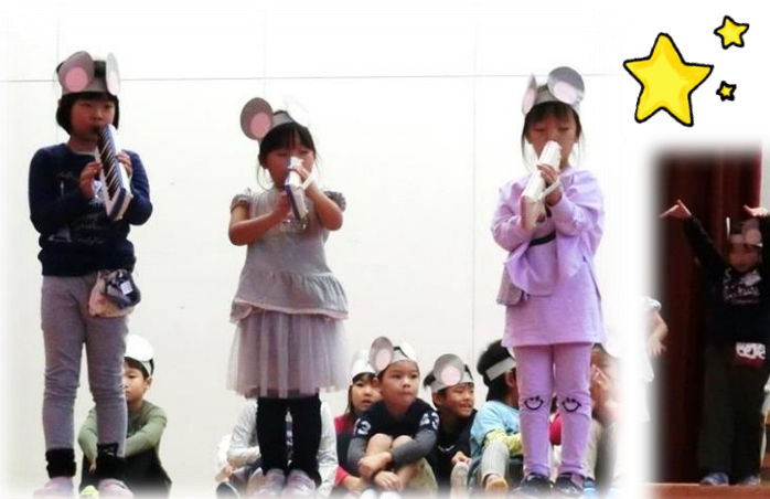
1年生 「おむすびころりん」