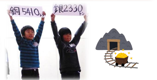
3年生 「佐渡金山のひみつ」